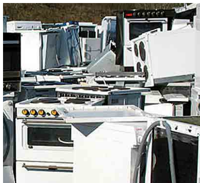
VELIKI GOSPODINJSKI APARATI